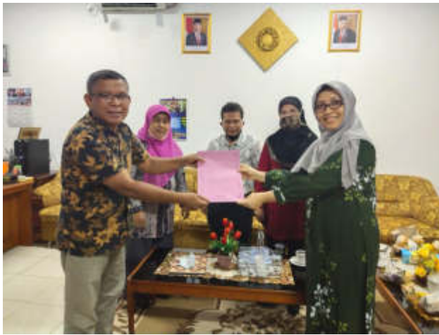
FOTO KEGIATAN AUDIT